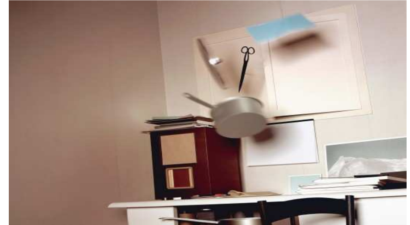
Juego de pistas. Niños de 4 a 6 años

En este juego de pistas vamos a observar los objetos que hay en las obras, son cosas que podemos identificar ya que forman parte de nuestro día a día, pero que aquí los artistas nos presentan de una manera diferente.